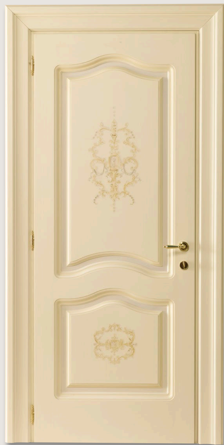
Mod. VILLA DEMIDOFF 744/QQ/Z Pant. Z veneziano patinato D-84 CF. Lory