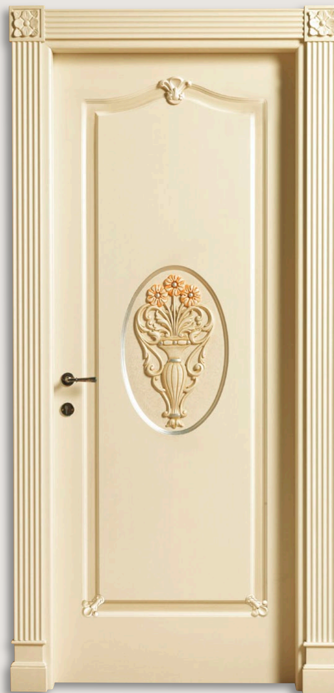
Mod. VILLA GRABAU 713 OV/QQ/A/AP/INT Pant. A Veneziano patinato D-33 (senza decoro) CF. Leo con fiore e tozz. inferiori Ovale con intaglio e applicazioni