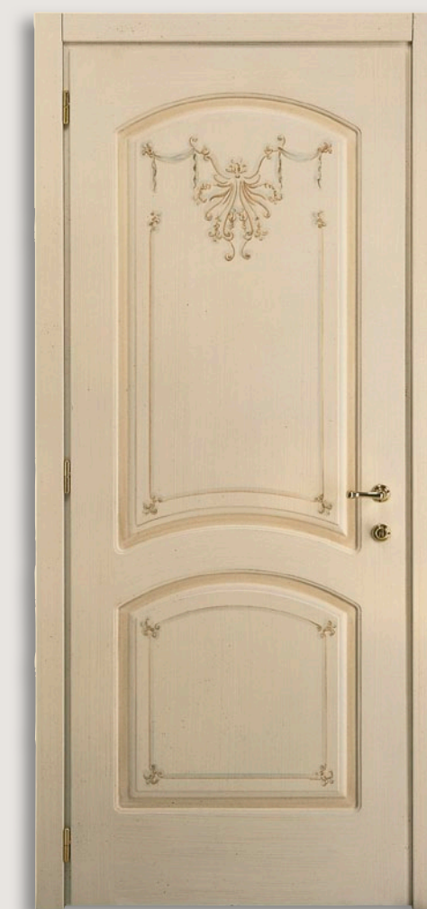
Mod. S. CANTOSI 722/QQ/B Pant. B finitura veneziano patinato D-1 CF. 8/7