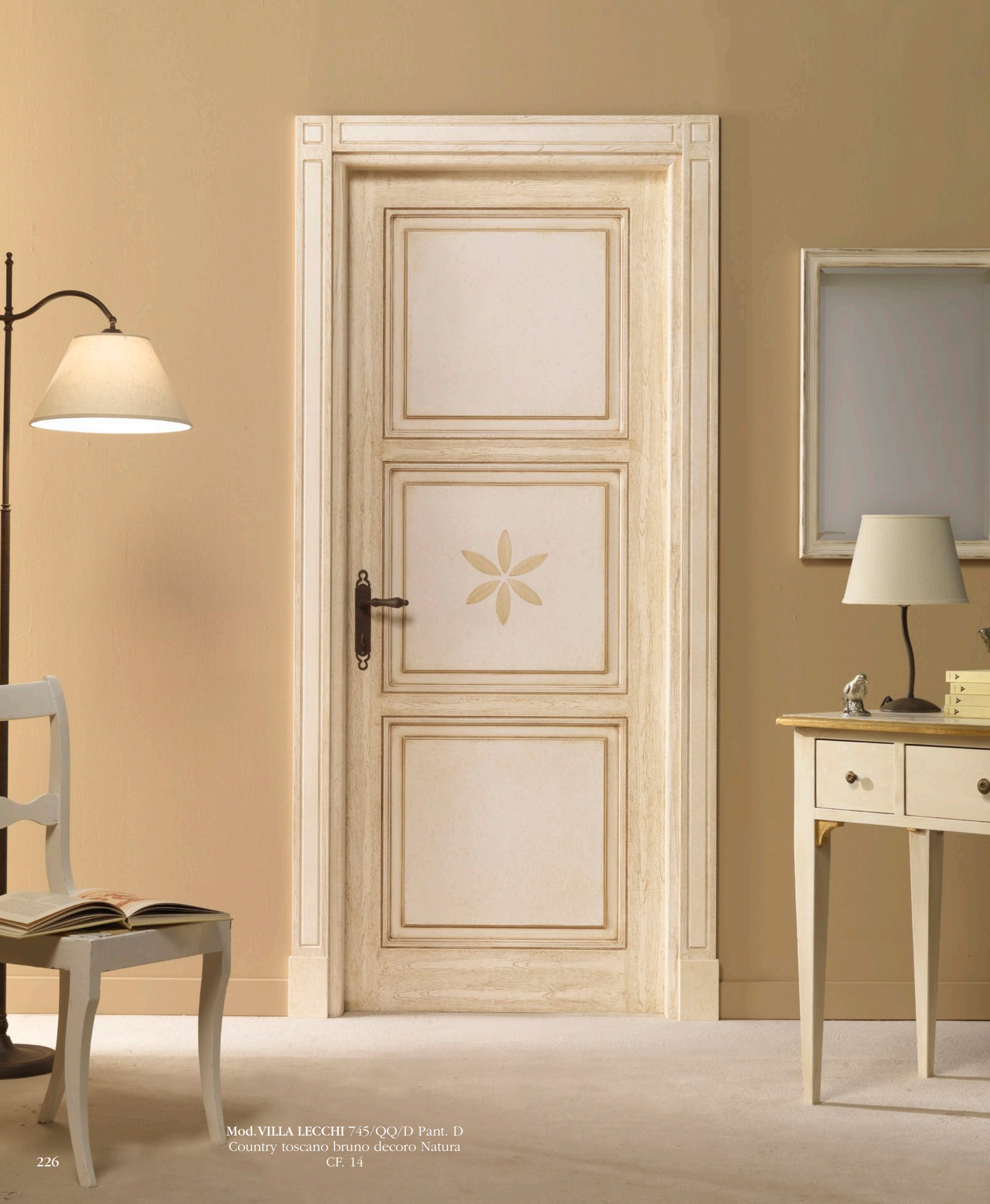
Mod. VILLA LECCHI 745/QQ/D Pant. D Country toscano bruno decoro Natura CF. 14