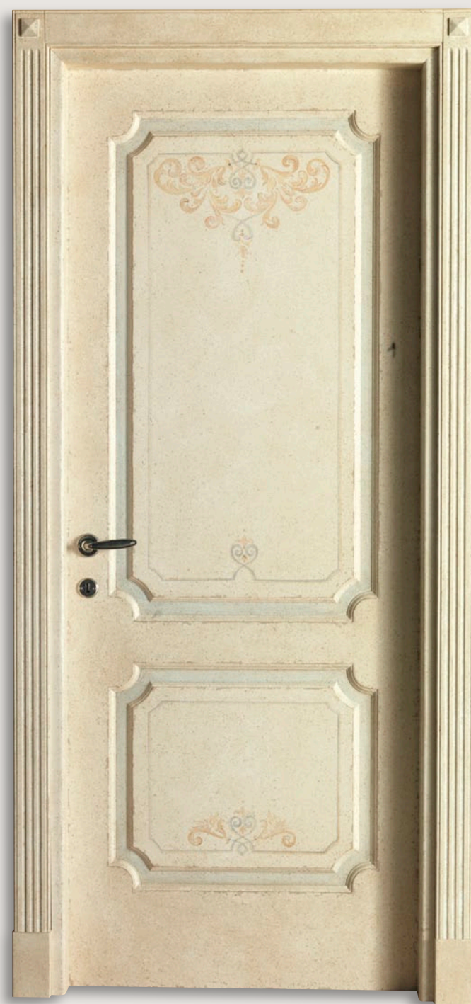
Mod. VILLA CARLOTTA 764/QQ/A Pant. A Antico acquerello D-60 CF. 5 con tozzetti inferiori e piramidi superiori