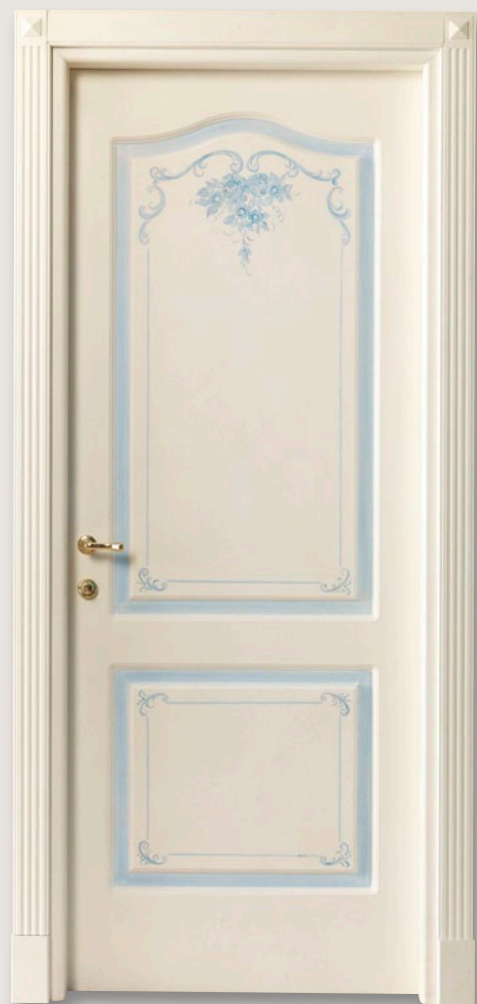
Mod. S.CANTOSI 712/QQ/A Pant. A Pannellato anticato decoro D-70 CF. 5 con tozzetti inferiori e piramidi superiori