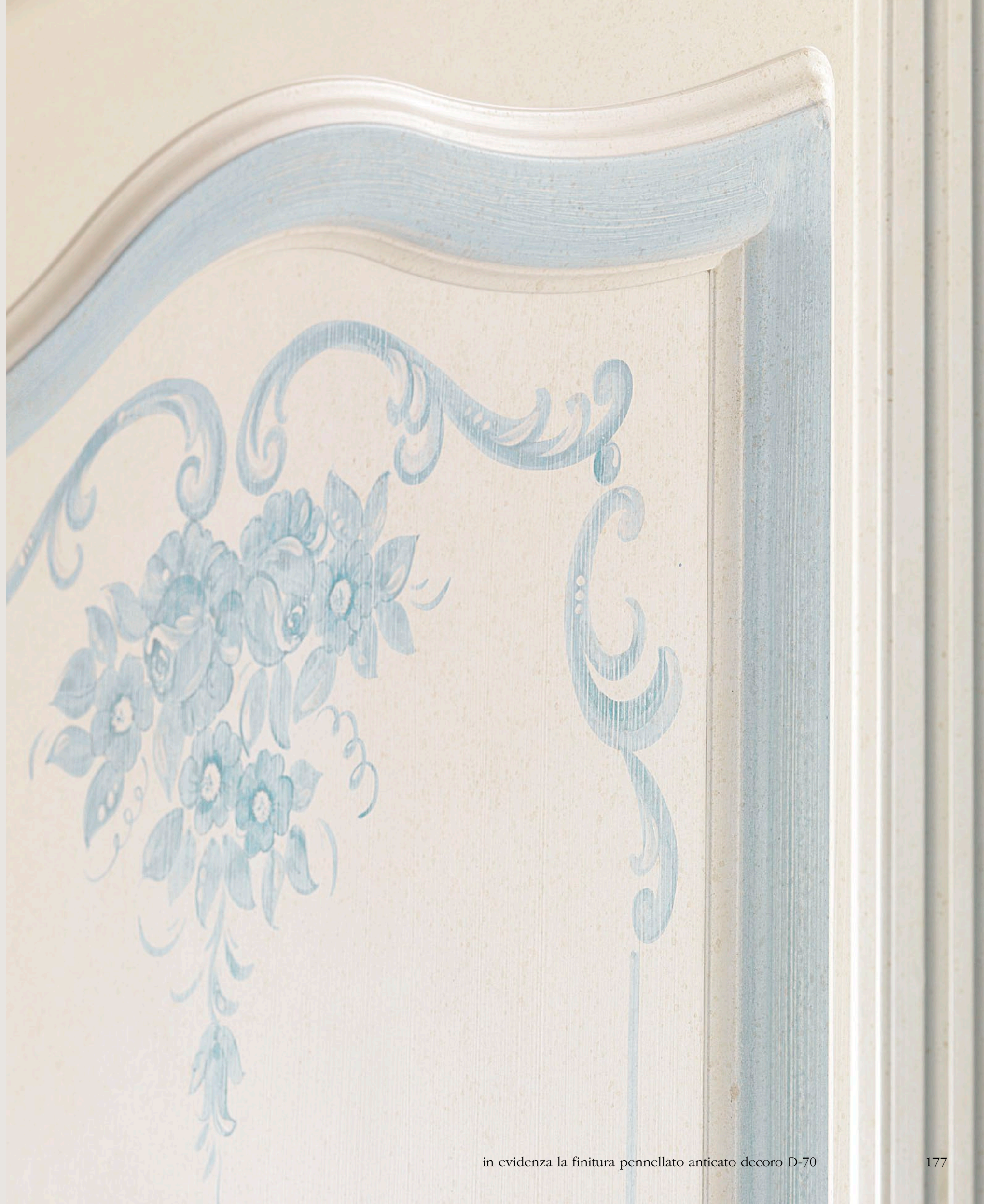
in evidenza la finitura pennellato anticato decoro D-70