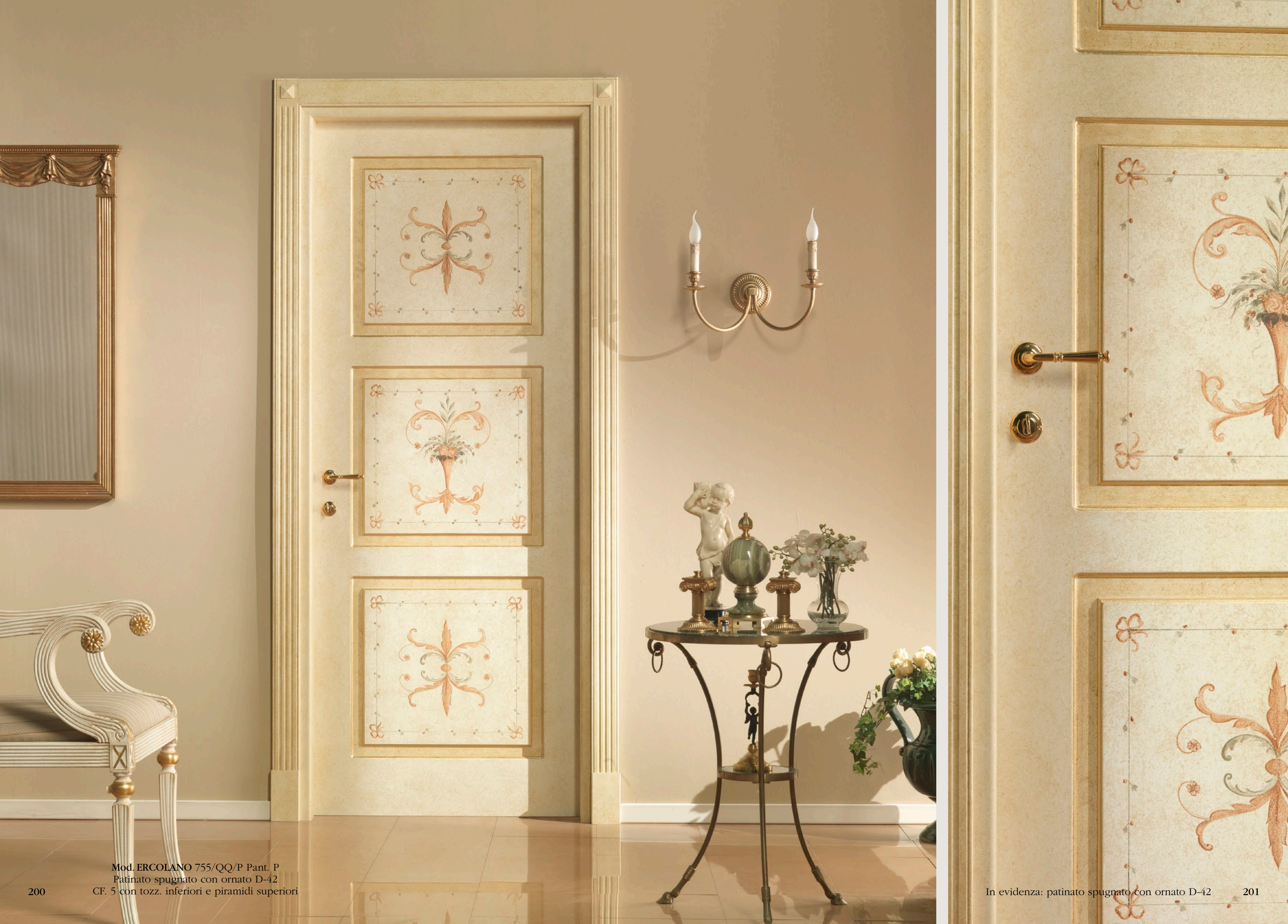
Mod. ERCOLANO 755/QQ/P Pant. P Patinato spugnato con ornato D-42 CF. 5 con tozz. inferiori e piramidi superiori