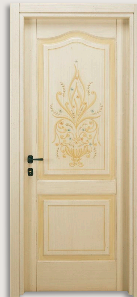
Mod. S. CANTOSI 712M/QQ/A Pant. A finitura veneziano patinato D-2 CF. 8/7