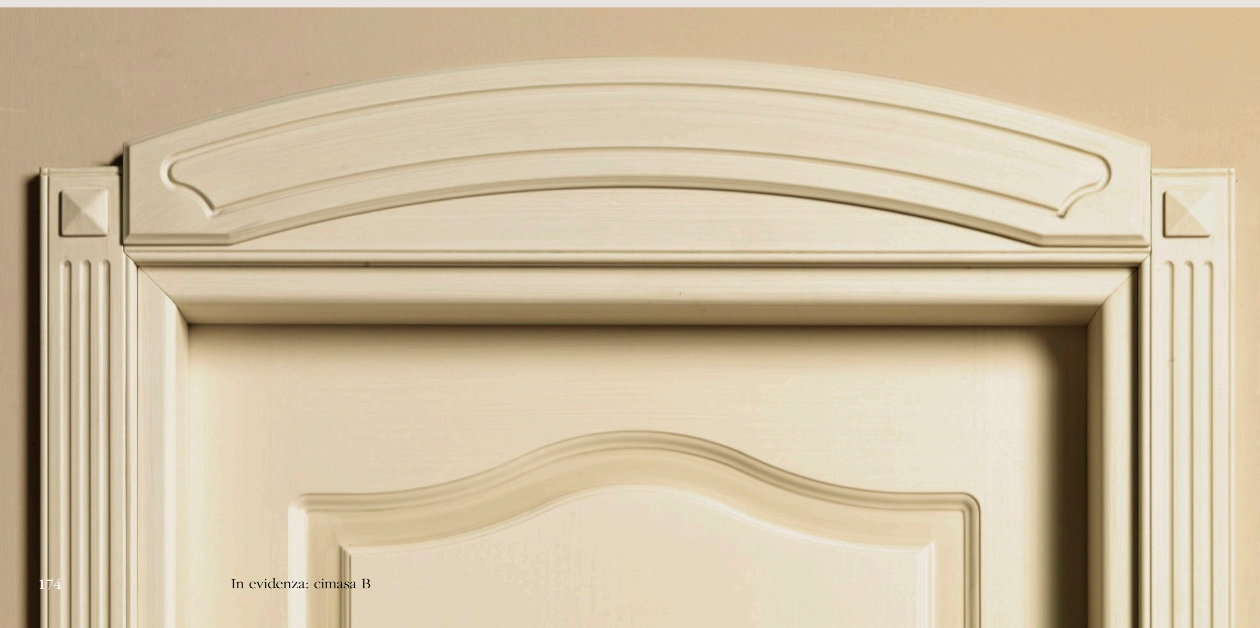
In evidenza: cimasa B