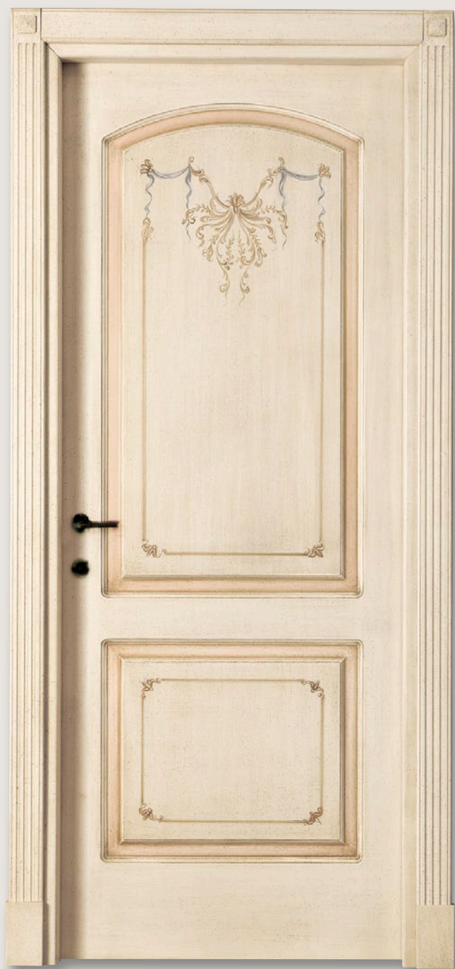
Mod. S.CANTOSI 722C/QQ/A Pant. A Pennellato Anticato D-20 CF. 5 con tozzetti inferiori e piramidi superiori