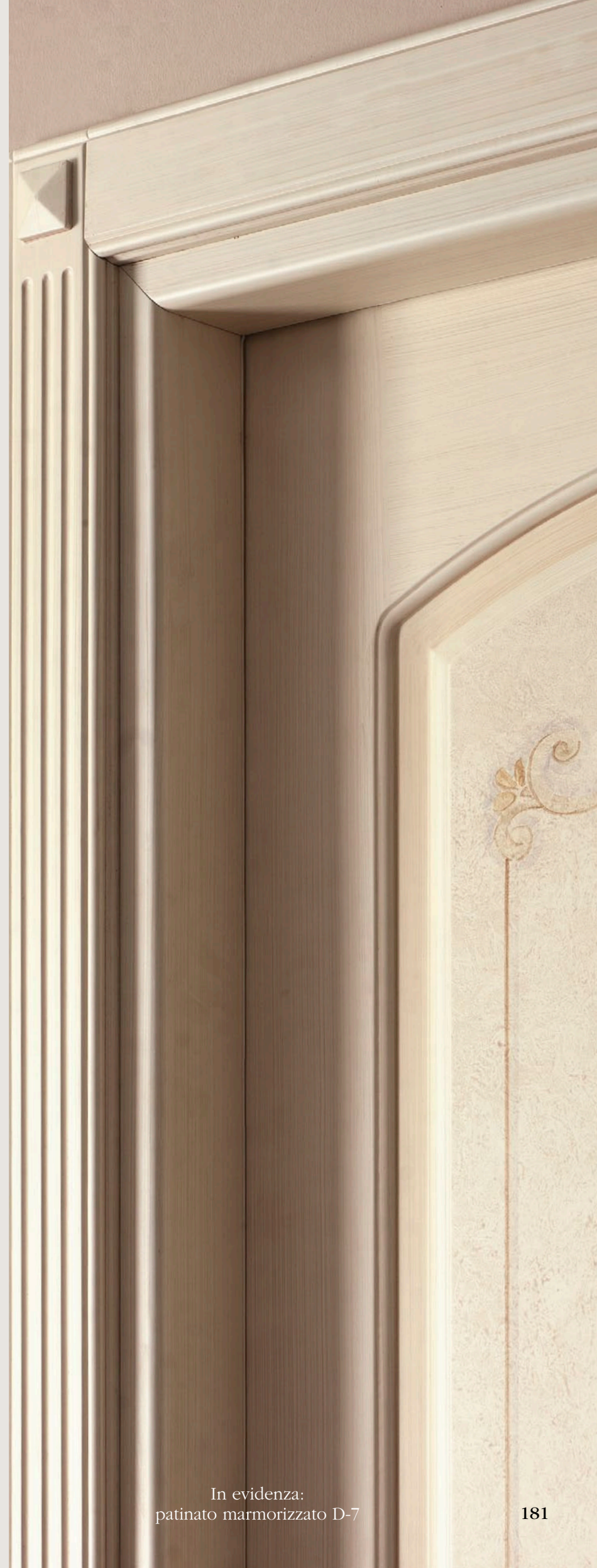
In evidenza: patinato marmorizzato D-7