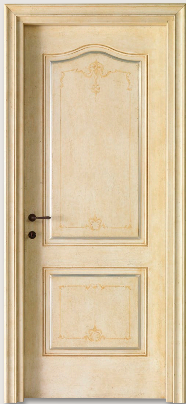
Mod. VILLA PIOVENE 712/QQ/E Pant. E Antiquariato D-52 CF. nuovo Barocco