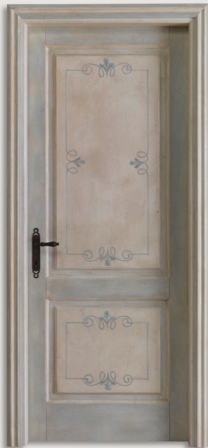
Mod. TIZIANO 714M/QQ/A Pant. A Finitura Bucciato invecchiato decoro Madrid CF. Nuovo Barocco