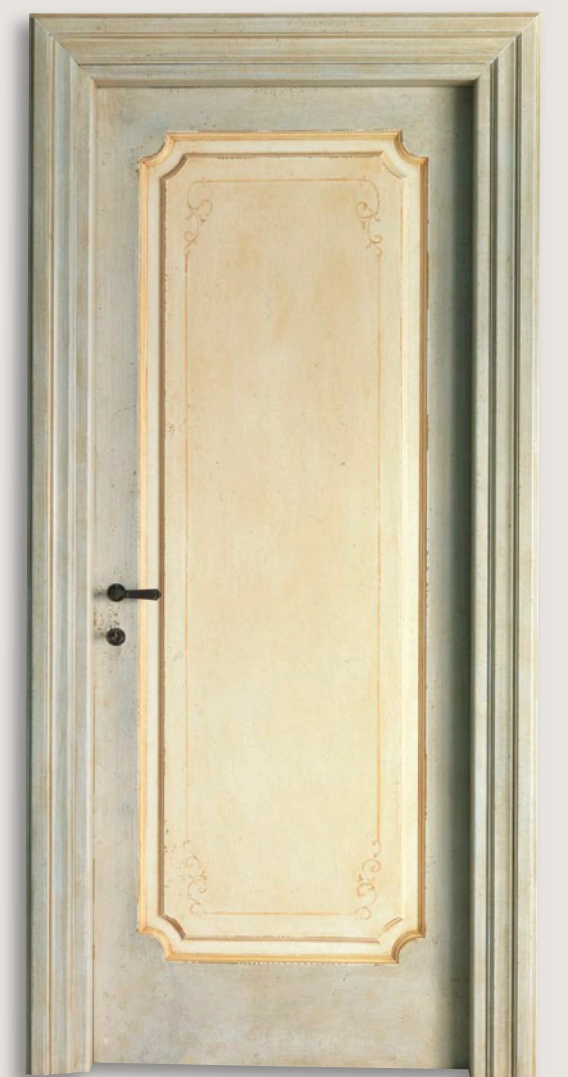
Mod. VILLA D'ESTE 763/QQ/A Pant. A Antiquariato decoro D-50 CF. Lory