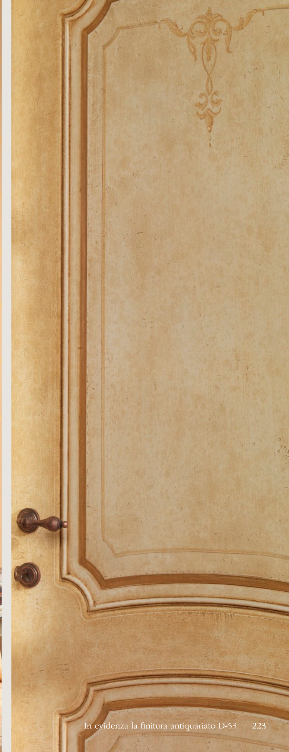
Mod. VILLA LA ROTONDA 762/QQ/E Pant. E Antiquariato D-53 CF. 5 con tozzetti inferiori e piramidi superiori