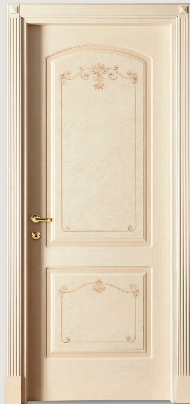
Mod. S.CANTOSI 722C/QQ/B Pant. B Patinato Marmorizzato D-7 CF. 5 con tozzetti inferiori e piramidi superiori