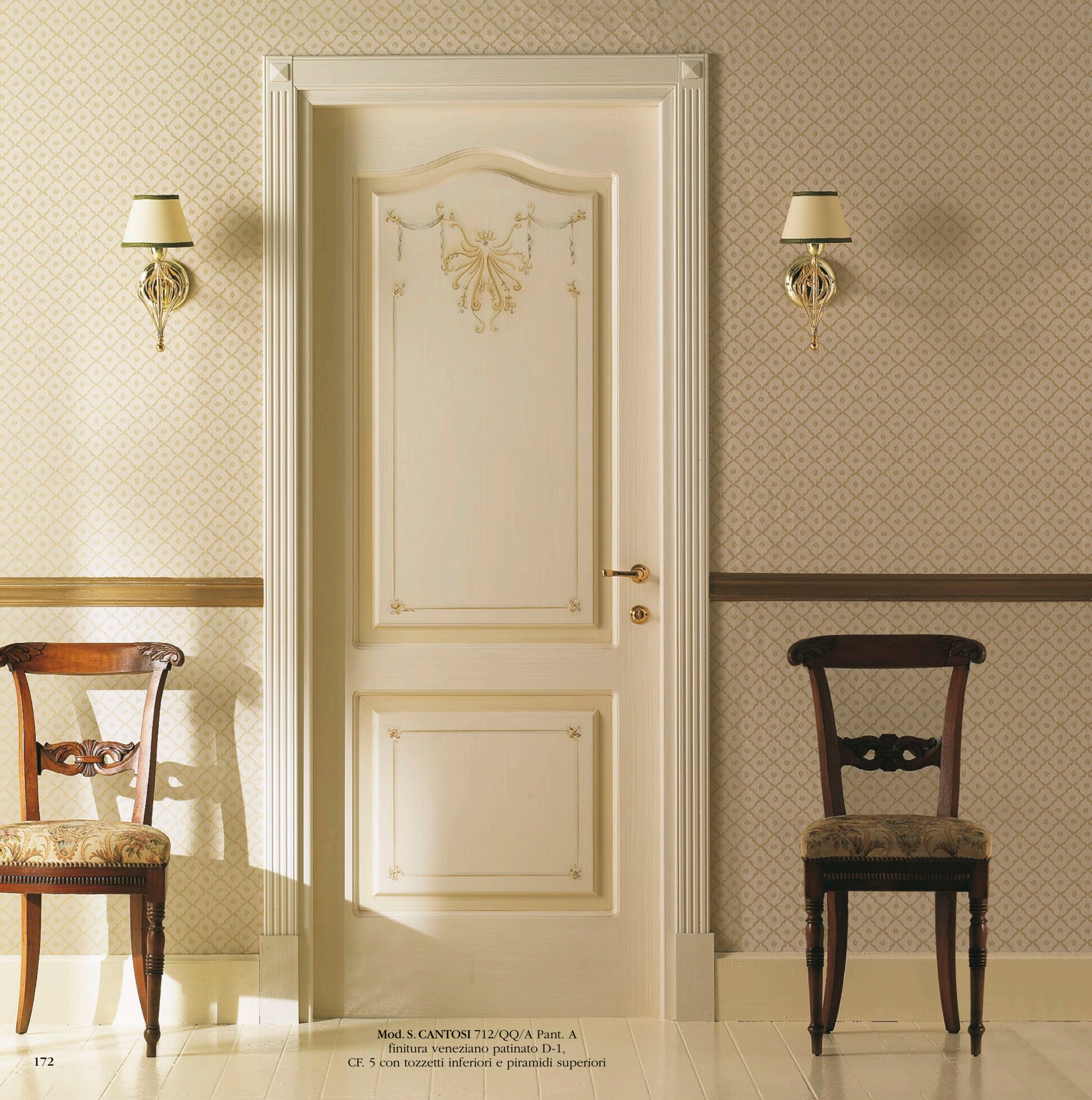
Mod. S. CANTOSI 712/QQ/A Pant. A finitura veneziano patinato D-1, CF. 5 con tozzetti inferiori e piramidi superiori