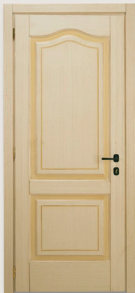
Mod. S.CANTOSI 712M/QQ/A Pant. A veneziano patinato D-2 (senza decoro) CF. 8/7