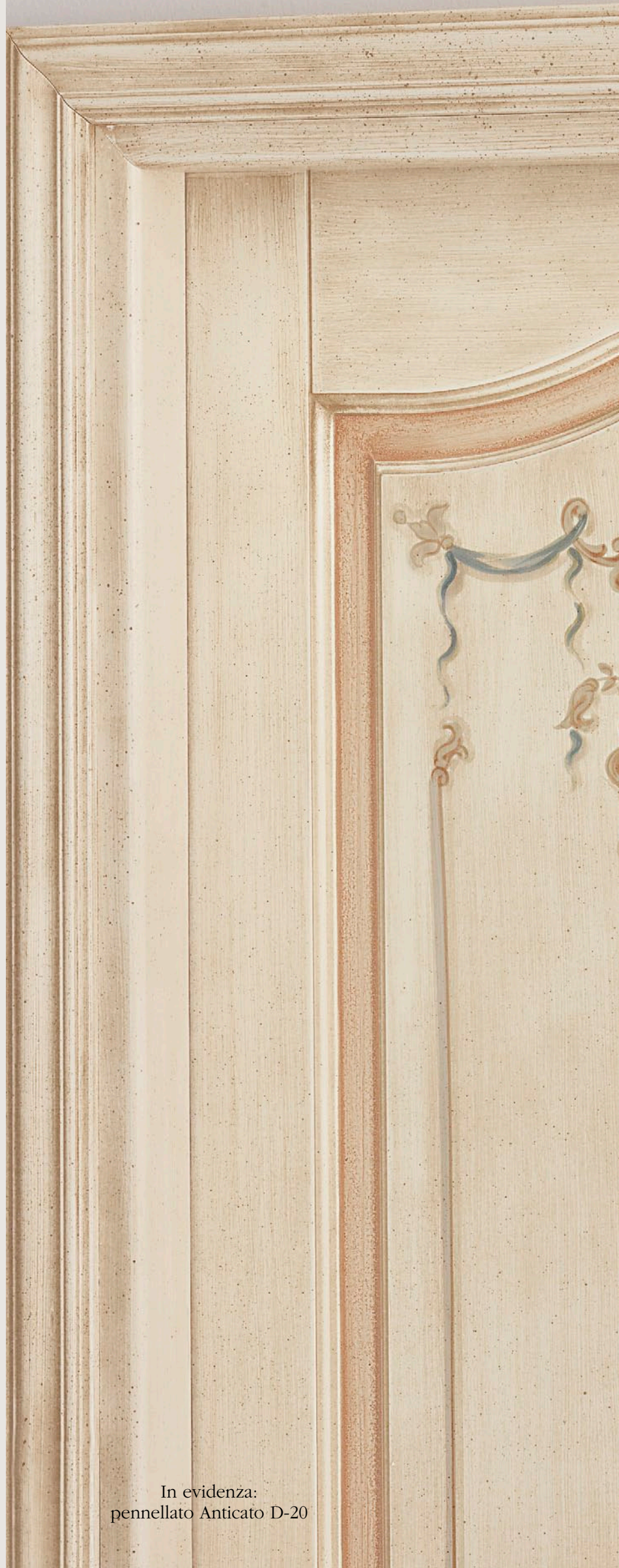
In evidenza: pennellato Anticato D-20