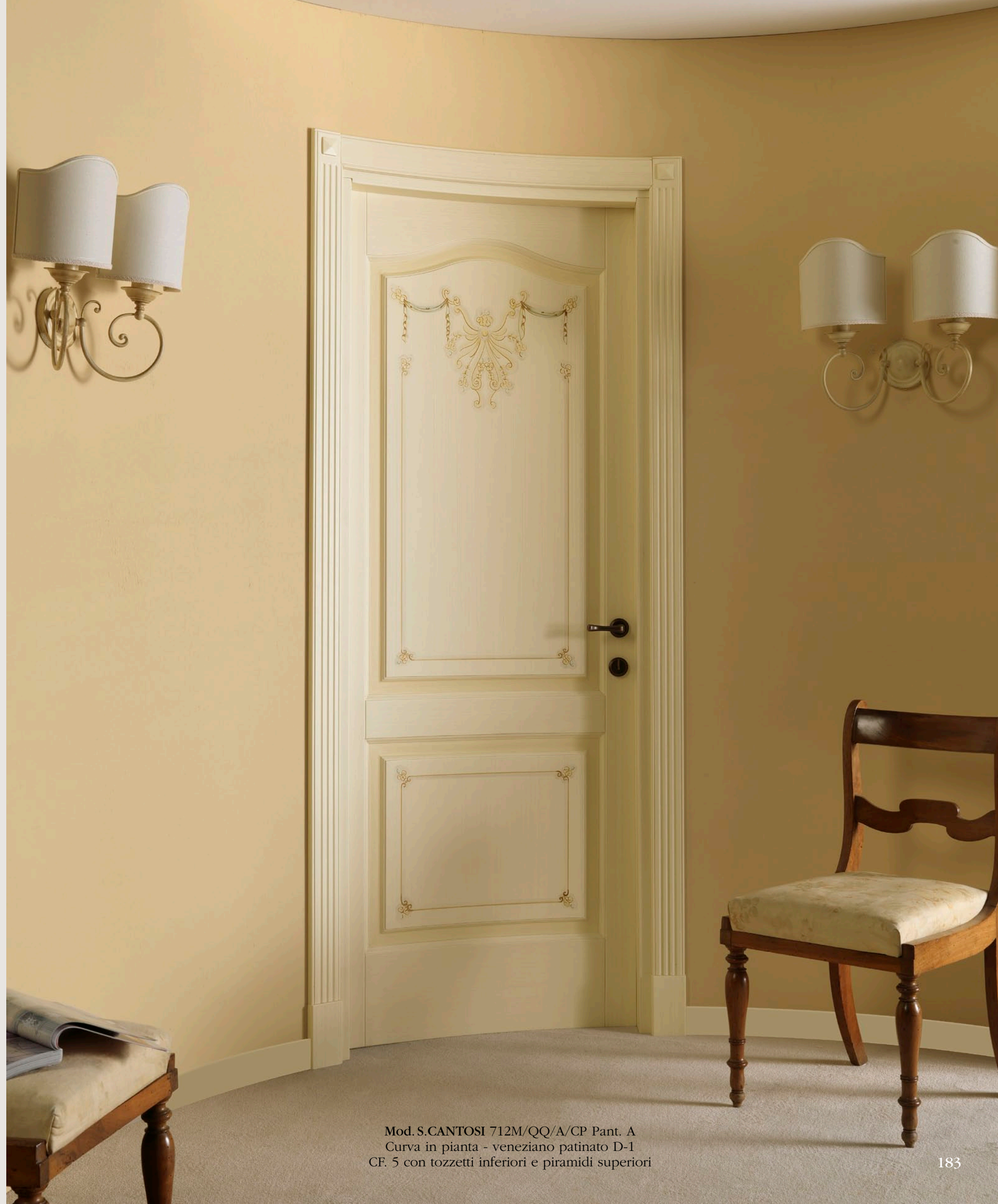
Mod. S.CANTOSI 712M/QQ/A/CP Pant. A Curva in pianta - veneziano patinato D-1 CF. 5 con tozzetti inferiori e piramidi superiori