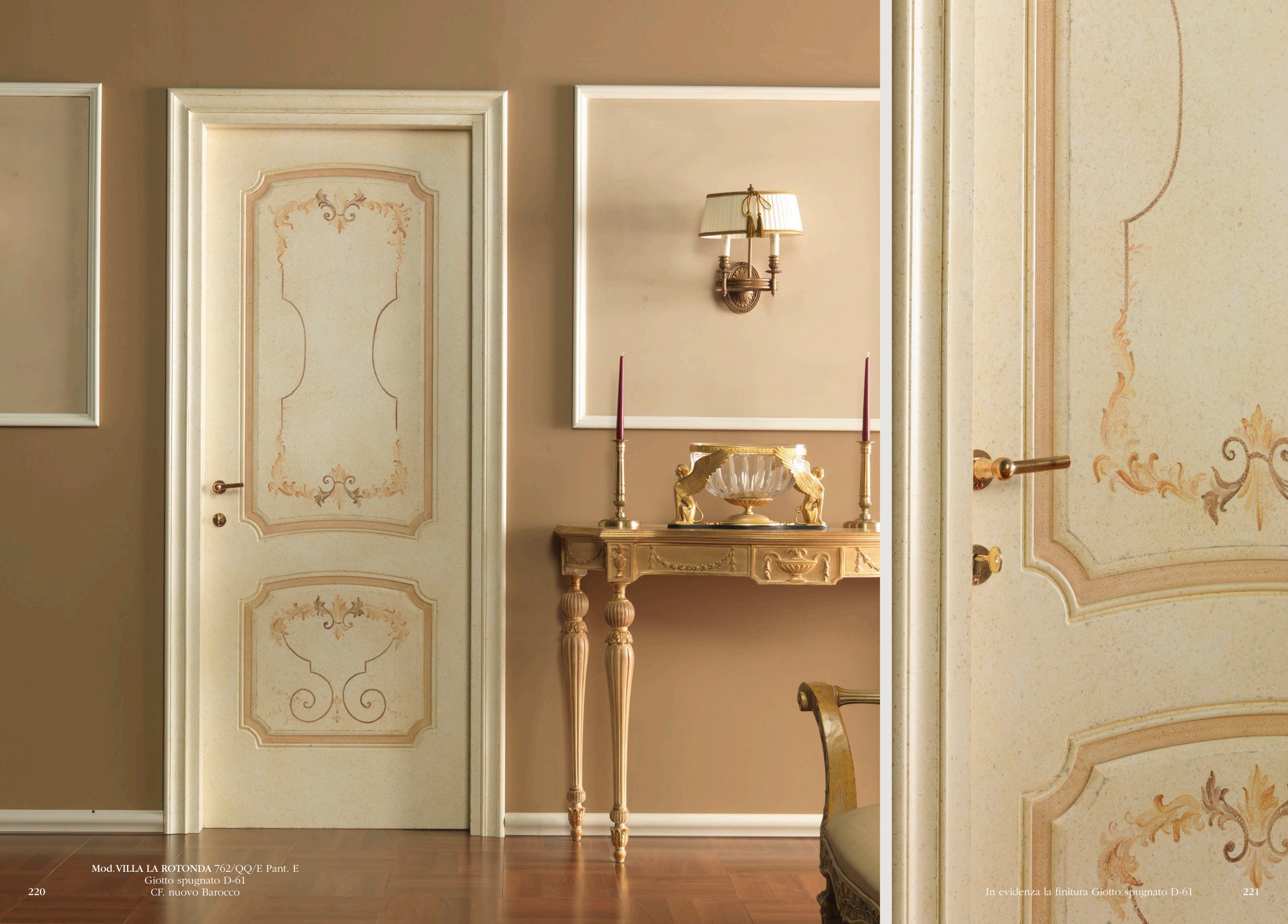
Mod. VILLA LA ROTONDA 762/QQ/E Pant. E Giotto spugnato D-61 CF. nuovo Barocco