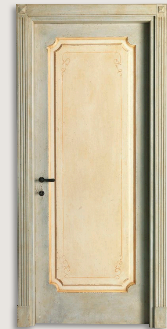
Mod. VILLA D'ESTE 763/QQ/A Pant. A Antiquariato decoro D-50 CF. 5 con tozz. inferiori e piramidi superiori