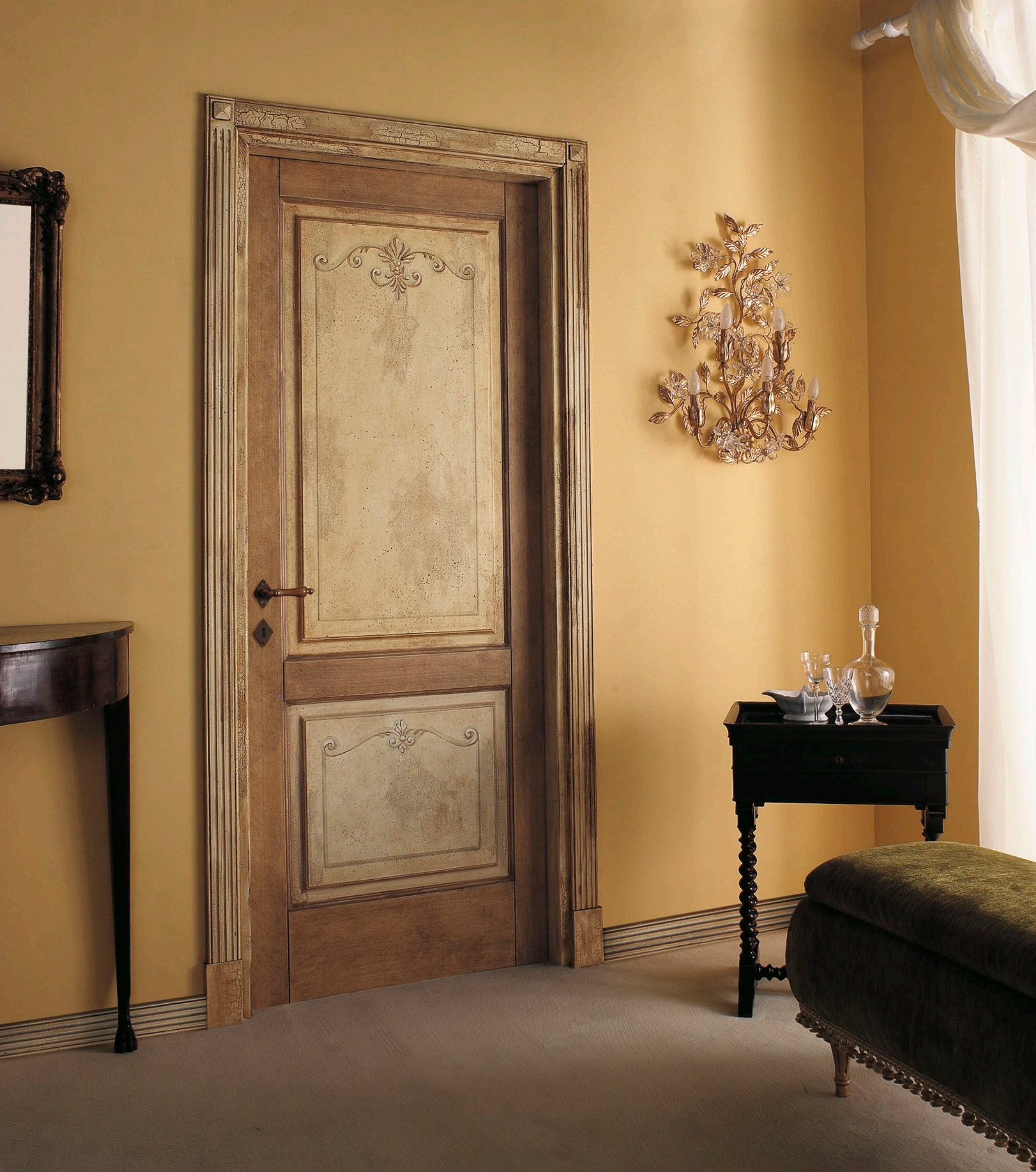
Mod. TIZIANO 714M/QQ/A Pant. A Craquelé screziato D-32 CF. 5 con tozz. inferiori e piramidi superiori