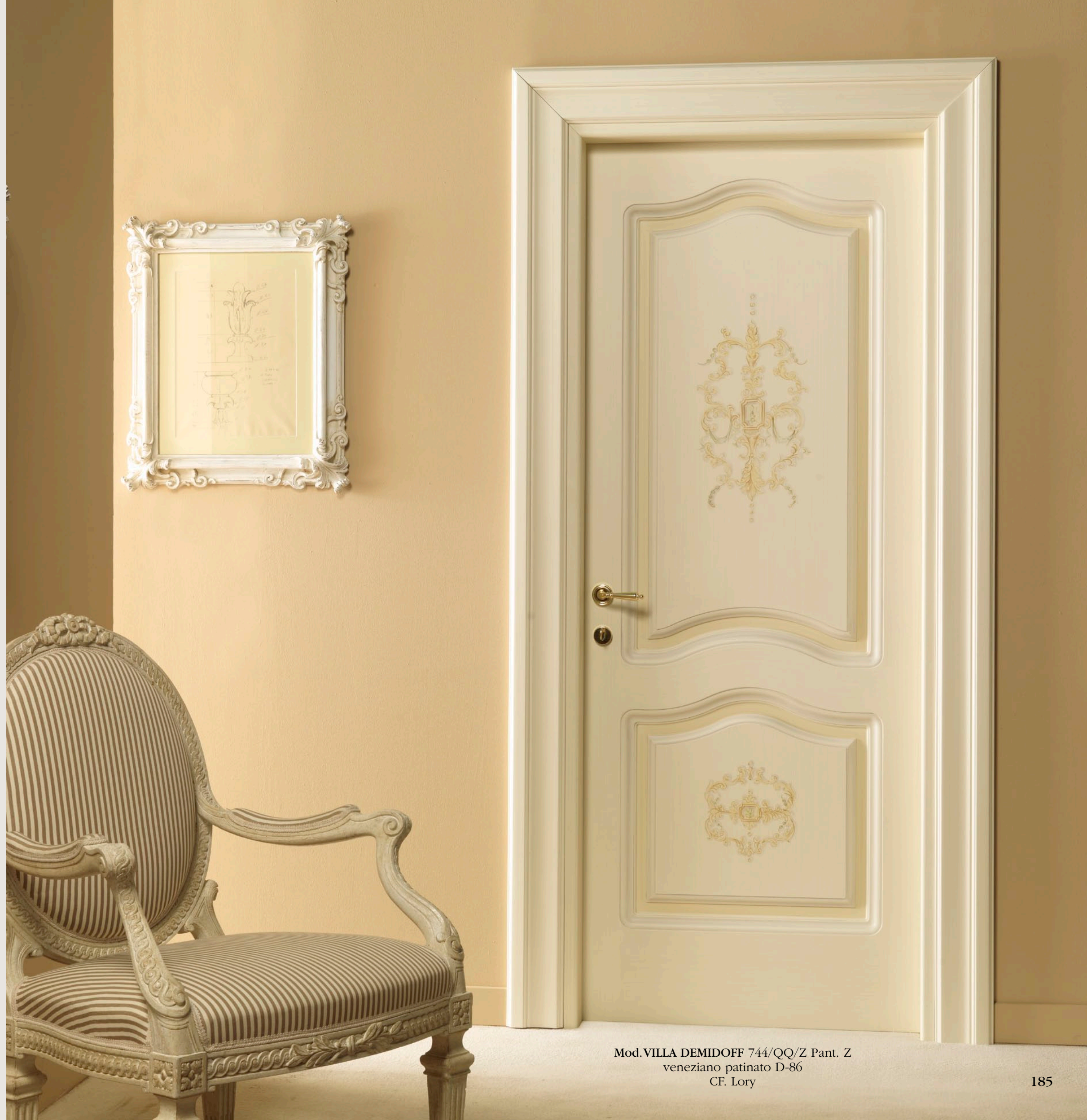
Mod. VILLA DEMIDOFF 744/ QQ/ Z Pant. Z veneziano patinato D-86 CF. Lory