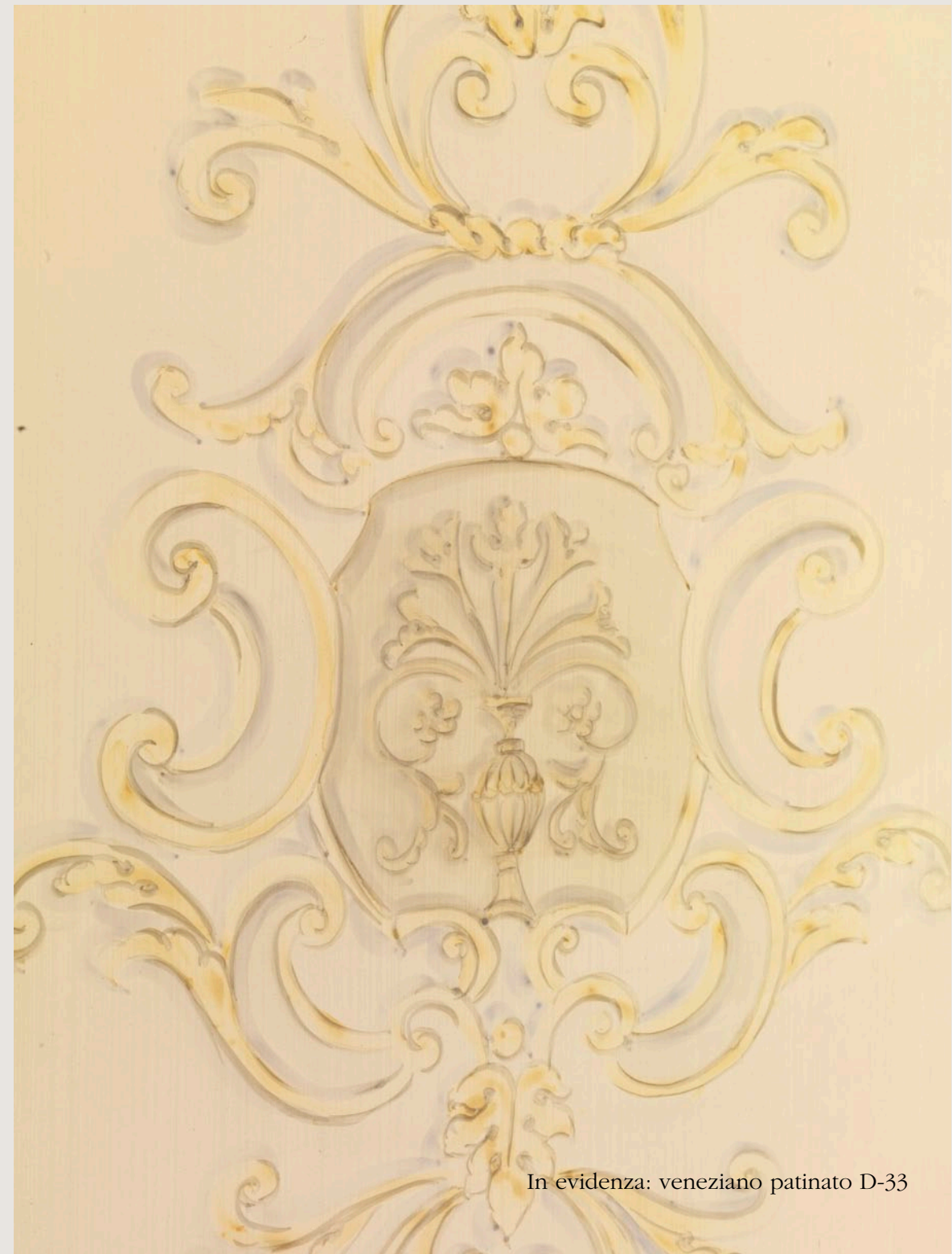
In evidenza: veneziano patinato D-33