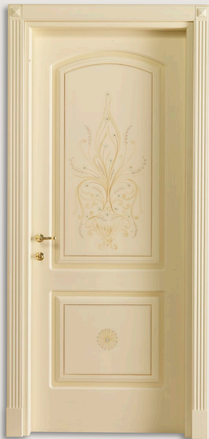
Mod. S.CANTOSI 722C/QQ/B Pant. B veneziano patinato D-82 CF. 5 con tozzetti inferiori e piramidi superiori