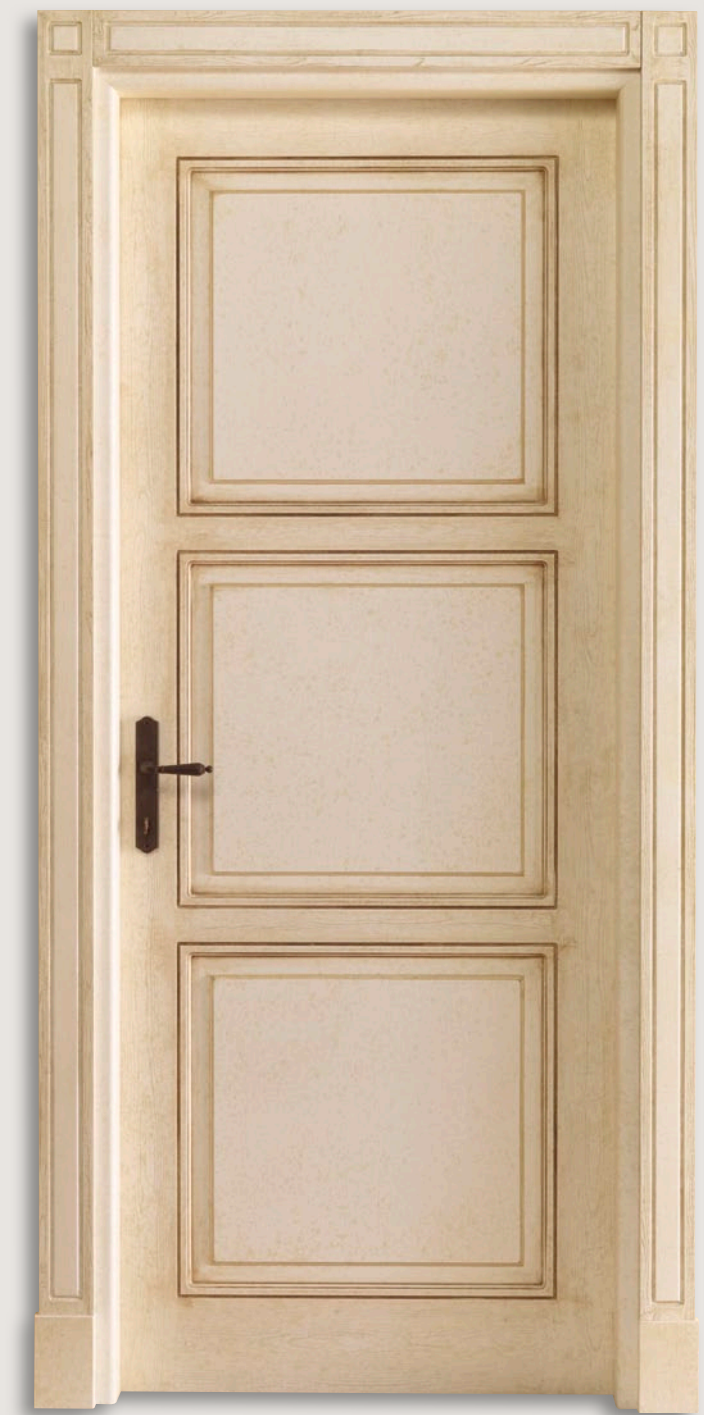
Mod. VILLA LECCHI 745/QQ/D Pant. D Country toscano bruno (senza decoro) CF. 14