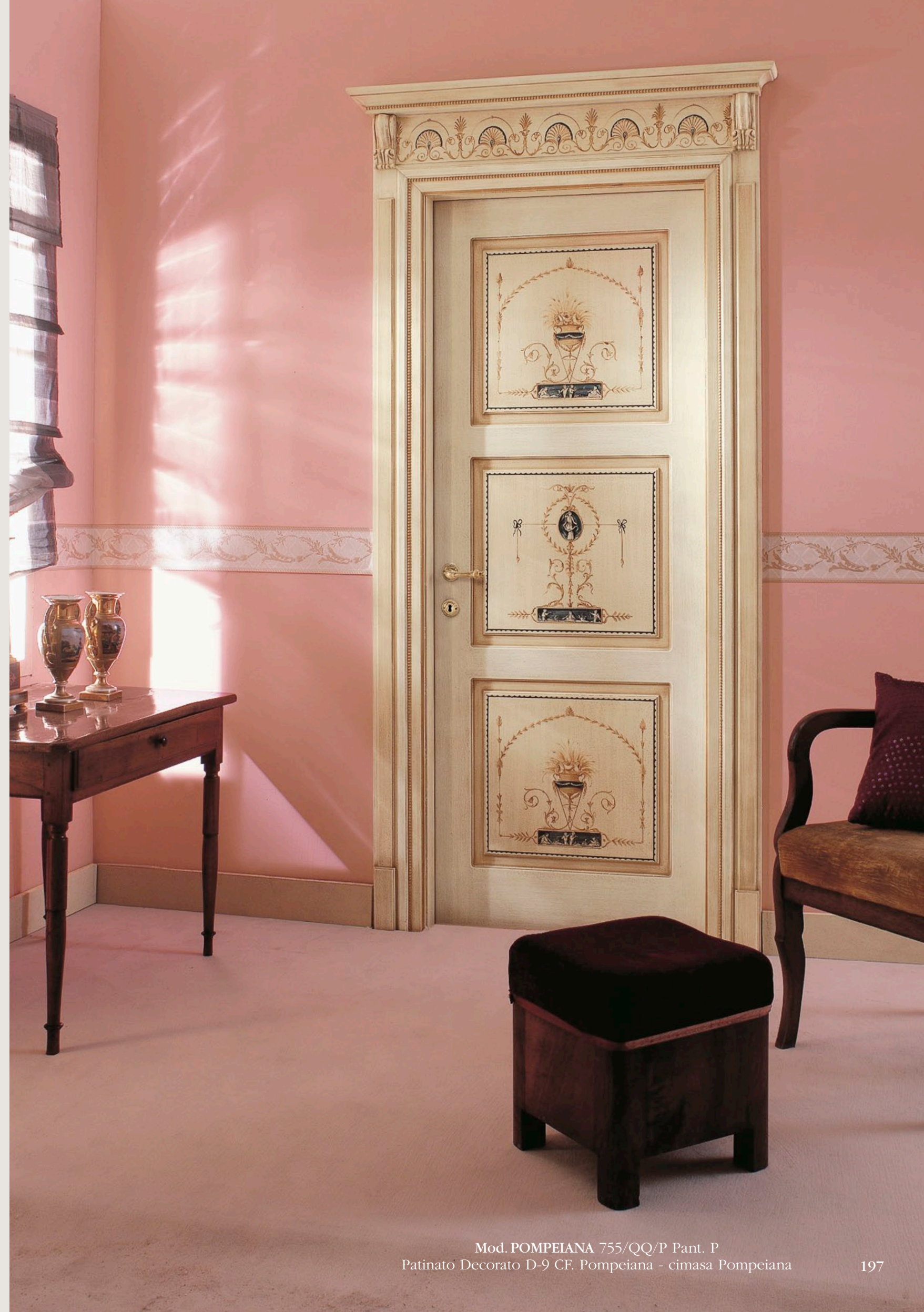
Mod. POMPEIANA 755/QQ/P Pant. P Patinato Decorato D-9 CF. Pompeiana - cimasa Pompeiana