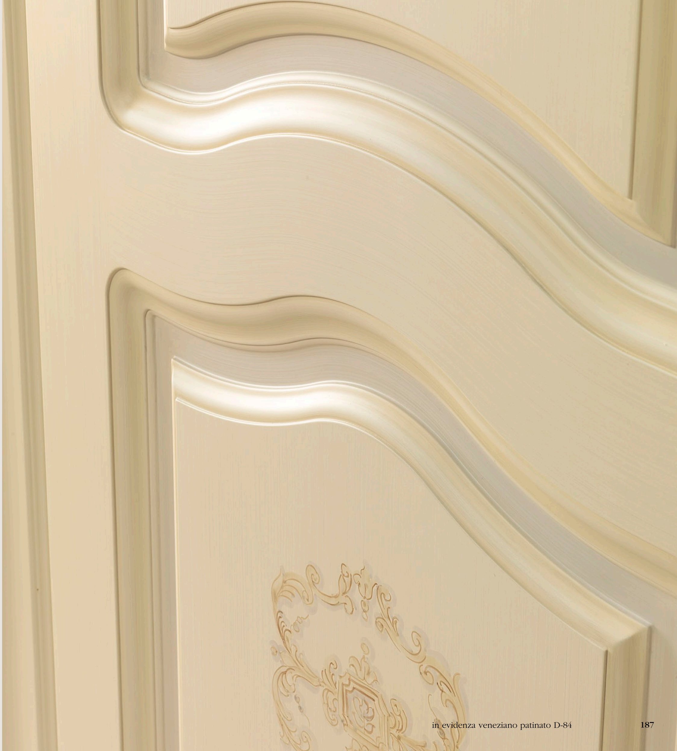
in evidenza veneziano patinato D-84