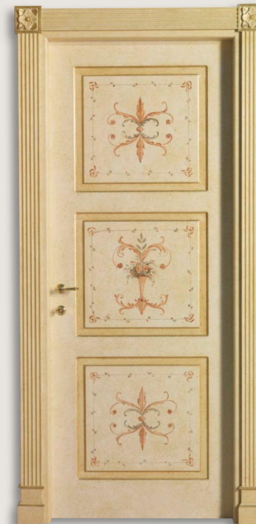
Mod. ERCOLANO 755/QQ/P Pant. P Patinato spugnato con ornato D-42 CF. Leo con fiori e tozz. inferiori