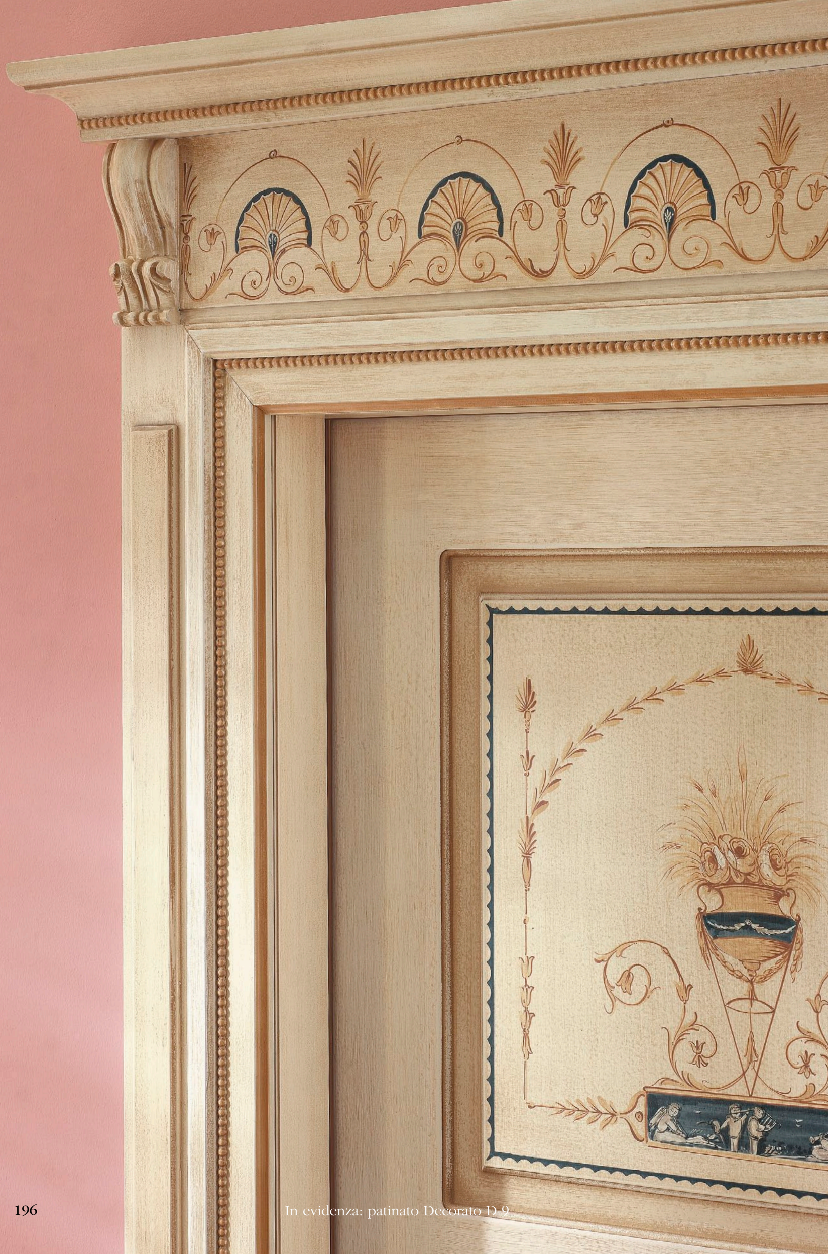
In evidenza: patinato Decorato D-9