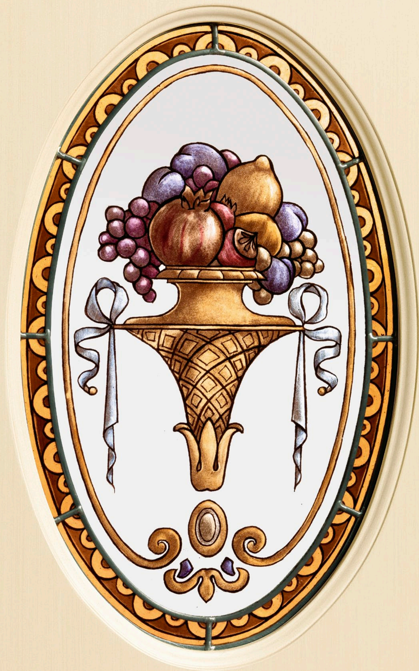
Il vetro LD-04 rilegato a piombo con decoro a grisaglia