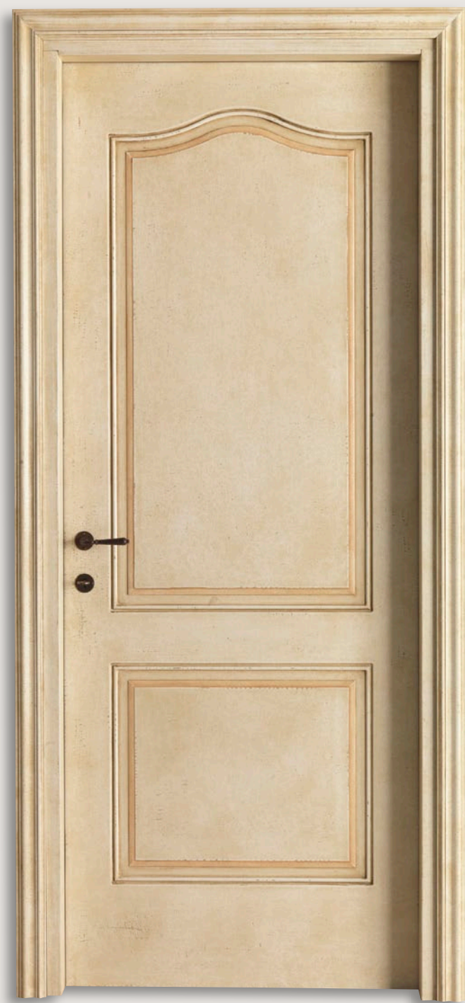
Mod. VILLA PIOVENE 712/QQ/E Pant. E Pergamena rigo aragosta CF. Barocco