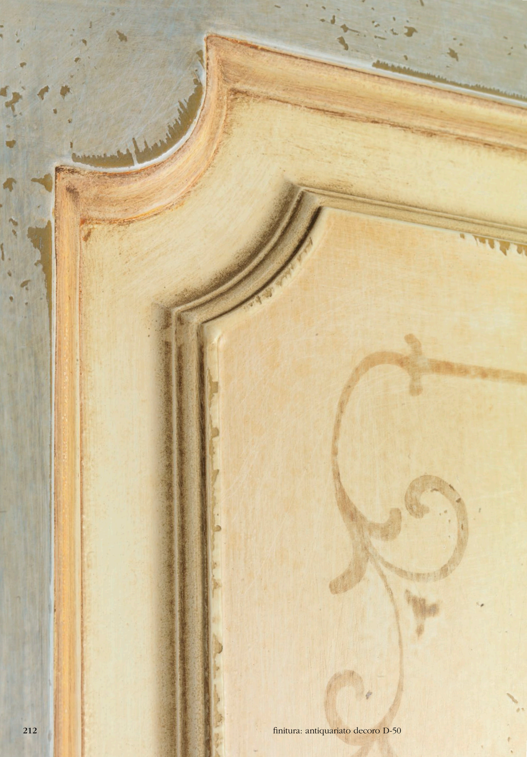
finitura: antiquariato decoro D-50