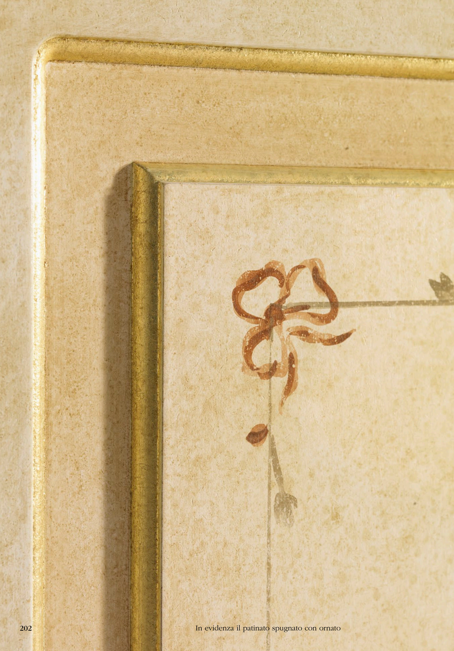
In evidenza il patinato spugnato con ornato