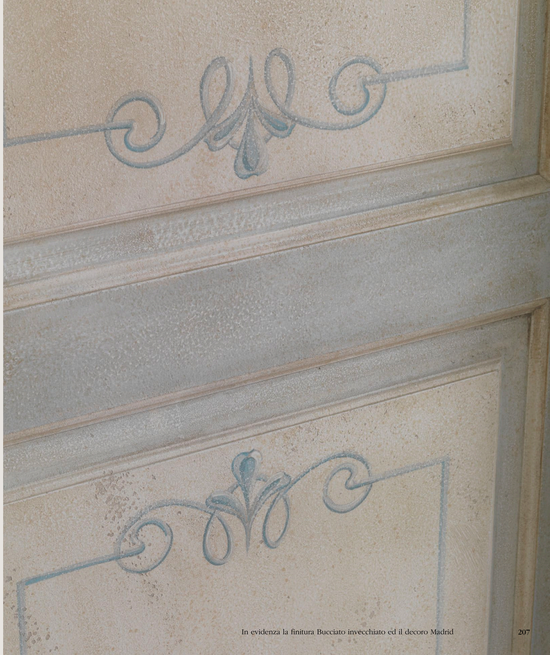
In evidenza la finitura Bucciato invecchiato ed il decoro Madrid