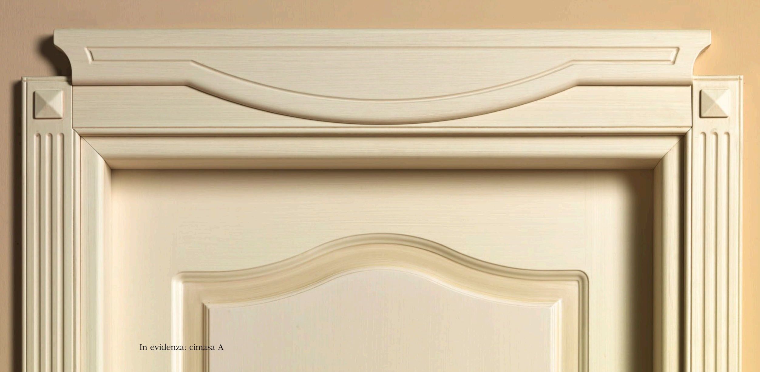
In evidenza: cimasa A