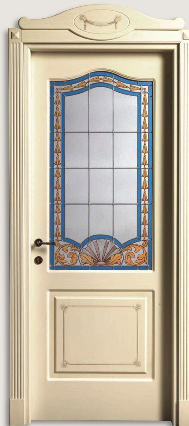
Mod. CANTOSI 712/qq/a/v Pant. A Veneziano patinato D-1 vetro LD-03 cimasa C con decoro D-1 CF. 5 con tozz. inferiori e piramidi superiori