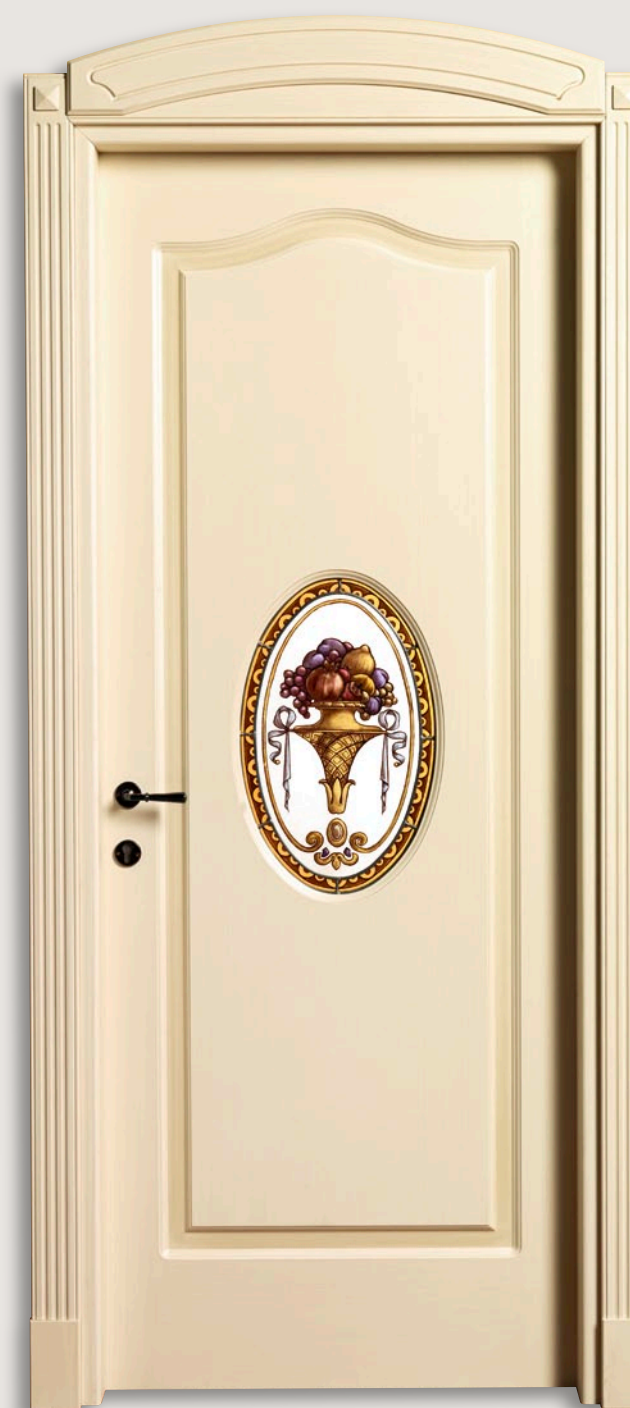
Mod. VILLA GRABAU 713 OV/ QQ/A/V Pant. A Veneziano patinato D-33 (senza decoro) CF. 5 con tozz. inferiori e piramidi superiori vetro LD-04 - cimasa B