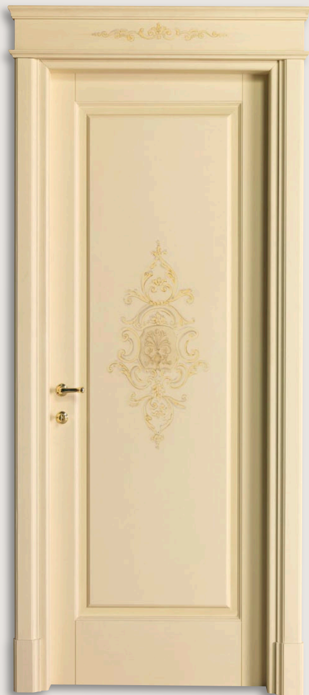
Mod. BISANZIO 713RM/QQ/A Pant. A Veneziano patinato D-33 CF. Bisanzio - cimasa Bisanzio